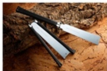
ПИЛЫ TAKERUVOY 240-18+10

WOODBOY 240-32 ТАКЖЕ ЕСТЬ МОДЕЛЬ С ПОЛОТНОМ DOZUKI С ОБУШКОМ (ДЛЯ ЛАСТОЧКИНЫХ ХВОСТОВ).