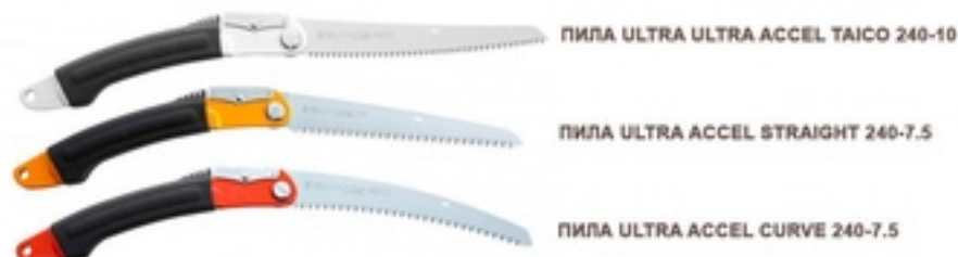
ПИЛА ULTRA ULTRA ACCEL TAICO 240-10

ПИЛА ULTRA ACCEL ИМЕЕТ ТРИ ТИПА ПОЛОТЕН: - 240 ММ ПРЯМОЕ ПОЛОТНО, ШАГ 7,5 -ОБЩЕГО НАЗНАЧЕНИЯ - 240 ММ ИЗОГНУТОЕ ПОЛОТНО, ШАГ 7,5 -ДЛЯ ОБРЕЗКИ НА ВЫСОТЕ ПЛЕЧА - 240 ММ ВЫГНУТОЕ ПОЛОТНО («ТАЙКО»), ШАГ 10 -ДЛЯ СУХОЙ И ТВЕРДОЙ ДРЕВЕСИНЫ