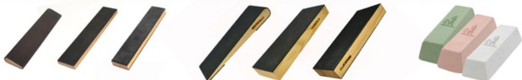
Бруски полировальные 150x30 мм