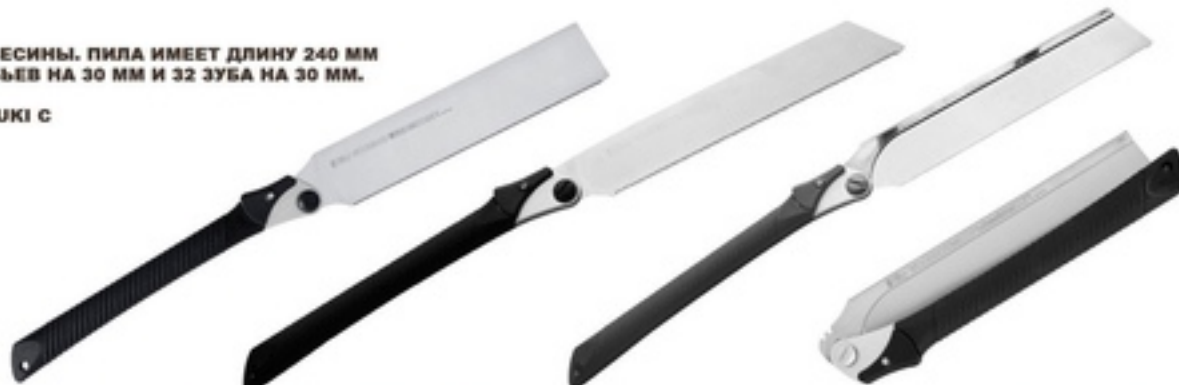
ПИЛЫ WOODBOY 240-32 (DOZUKI)