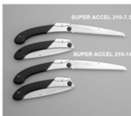
SUPER ACCEL 210-7.5

ПИЛЫ SUPER ACCEL ДОСТУПНЫ В ДВУХ ВИДАХ С ПОЛОТНОМ: КРУПНЫЙ ЗУБ (7,5 НА 30 ММ) И МЕЛКИЙ ЗУБ (14 НА 30 ММ).