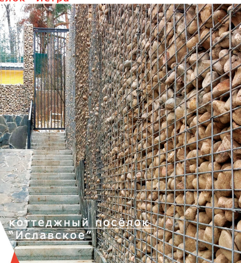
коттеджный посёлок "Истра" коттеджный посёлок "Иславское"