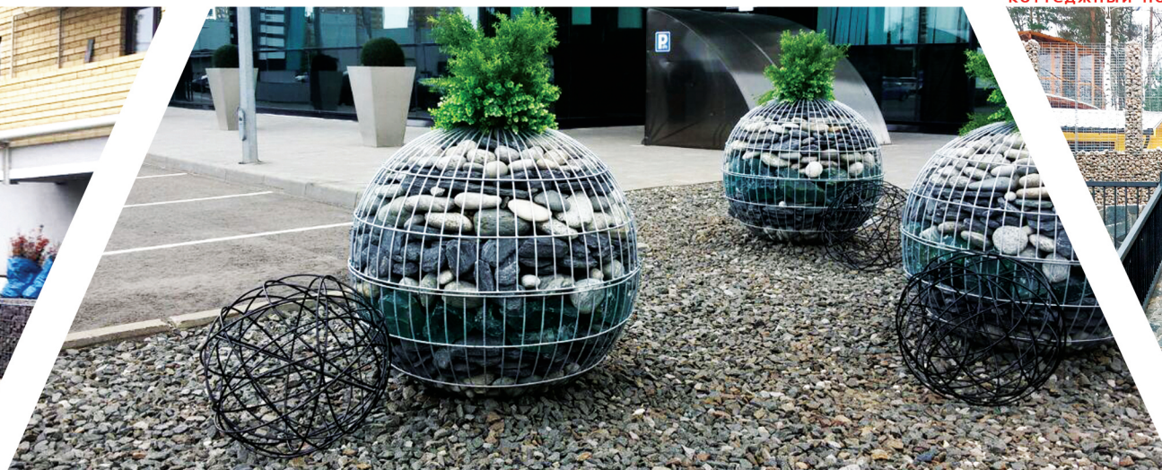
Использование наших габионов в ландшафтном дизайне ТЦ Мега Белая Дача